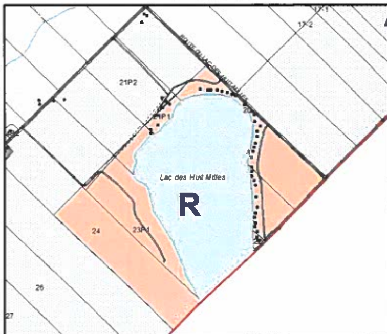
Modifications apportées au plan d’affectation à l’échelle 1:20000