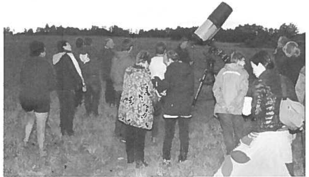
Plus d'une trentaine de personnes ont participé à la soirée d'astronomie et de dégustation des produits de La Vallée de la Framboise, le 26 août dernier.

L'activité du 1 er octobre a déjà atteint son objectif d'offrir 20 billets à des nouveaux pour assister au spectacle de Fabien Cloutier , présenté par Diffusion Mordicus. Cette activité est notamment rendue possible grâce à l'Entente de développement culturel de la MRC.